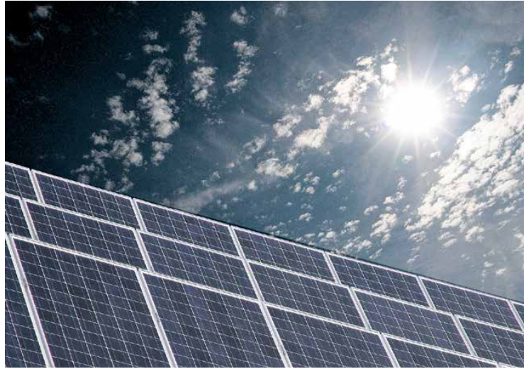
So kann die Energiewende aussehen: Bei Sonne läuft die Waschmaschine, auch das Elektroauto wird bevorzugt mit eigenem Solarstrom getankt